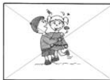
No abusar a la hora de jugar, respetando el juego de cada uno.

Láminas representando distintas emociones